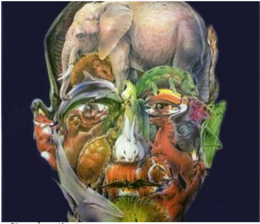
هل هذا وجه أم حديقة حيوان